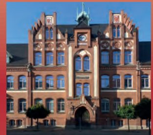
Kunsthaus · Ausstellungen, Konzerte, Restaurant