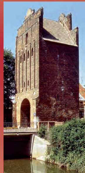
Neuperver Tor Katharinenkirche