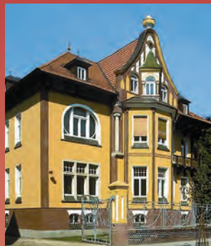
Stadt- und Kreisbibliothek · Lesungen, Ausstellungen, Konzerte