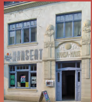
Hanseat · Soziokulturelles Zentrum: Konzerte, Kleinkunst, Gastronomie

Von der Tourist-Information aus gelangen Sie auf die Aussichtsplattform in 25 m Höhe.