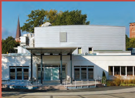
Kulturhaus Salzwedel · Das vielseitige und moderne Veranstaltungshaus der Region – von Theater über Tanz bis zu Kongressen