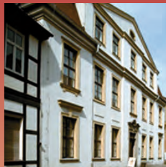
Geburtshaus von Jenny Marx