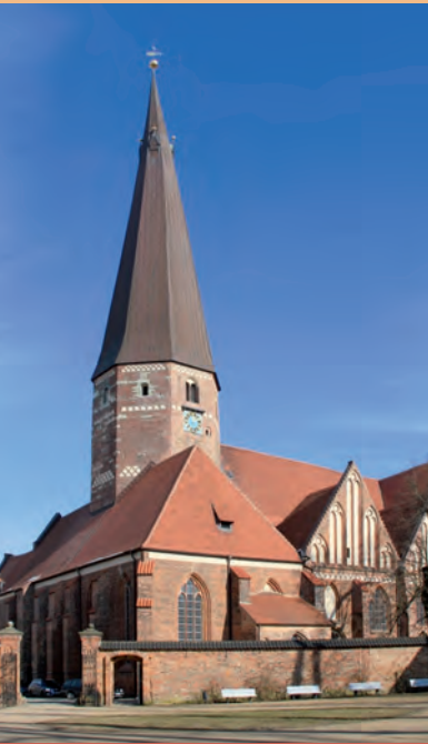
Marienkirche in der Altstadt

Der Stadtkern ist geprägt von mittelalterlicher Architektur, Fachwerkhäusern an malerischen Kopfsteinpflasterstraßen und prächtigen Backsteinkirchen. Von früherem Reichtum kündeten imposante Bürgerhäuser, z. B. das Geburtshaus von Jenny Marx, der Ehefrau von Karl Marx.