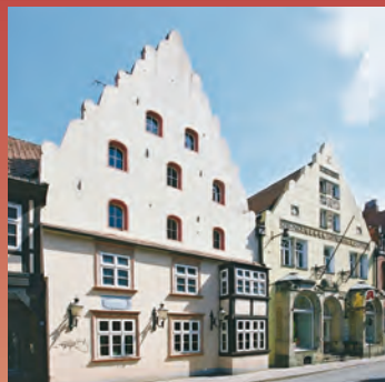
Gerichtslaube · Löwenapotheke