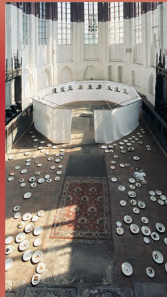
Mönchskirche · Konzert- und Ausstellungshalle

In Schaubäckereien können Sie die Herstellung ansehen.