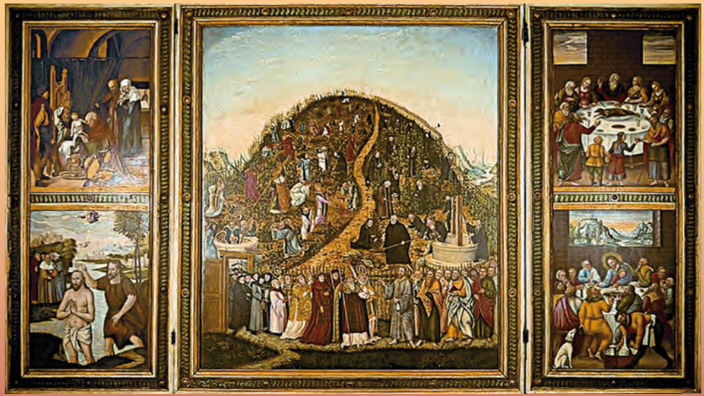
Im Museum: Weinberg-Altar von Lukas Cranach dem Jüngeren