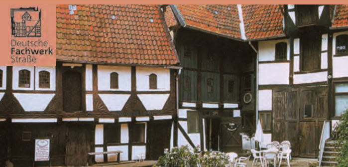
Deutsche Fachwerk Straße