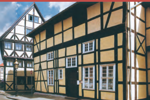
Hochständerhaus · Bürgermeisterhof