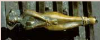
Türgriff mit Heiligem Laurentius

salzwedel.st-laurentius@bistum-magdeburg.de